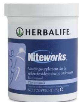
Niteworks™ #3150 – 48.75 VP

Een speciale combinatie van ingrediënten ter ondersteuning van de stikstofoxideproductie